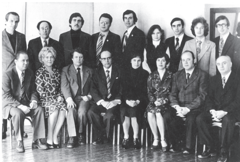
Кафедра народных инструментов УГК (1979).